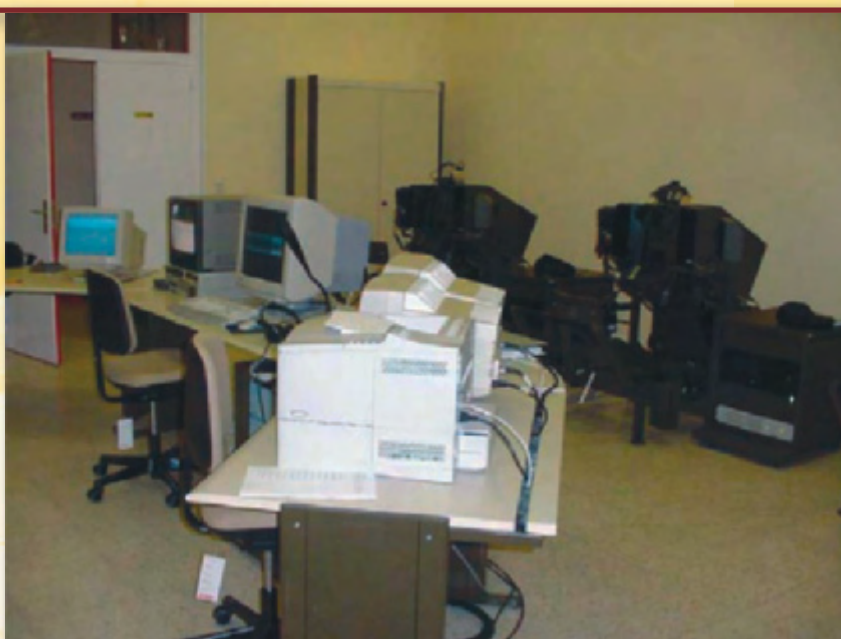
Simulador del cañón 35/90.

Al haberse llevado a cabo con tecnología totalmente española, y gracias a los contratos de mantenimiento ya suscritos, queda garantizada su constante operatividad y rendimiento.