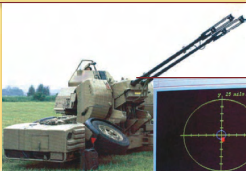
Imagen superior cañón 35/90 GDF 005.

Aunque normalmente cada estación ETS ejecutará los ejercicios con independencia de las otras dos estaciones, se podrán conectar entre ellas para participar en el mismo ejercicio, de tal manera que puedan ver y disparar sobre la misma amenaza, incluso ver las explosiones producidas por los impactos de las otras estaciones.