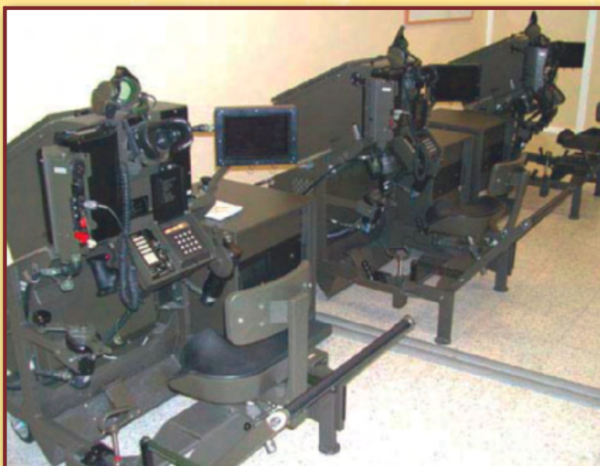
puestos de apuntador /tirador.

Al finalizar el ejercicio se presentarán tanto al apuntador como al instructor una evaluación final, pudiéndose grabar y almacenar las evaluaciones del