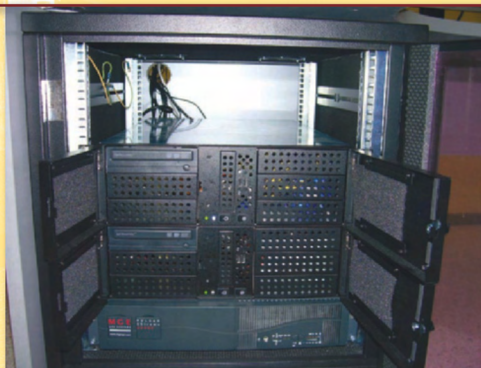
Sistema de visuales 3D del apuntador/tirador.