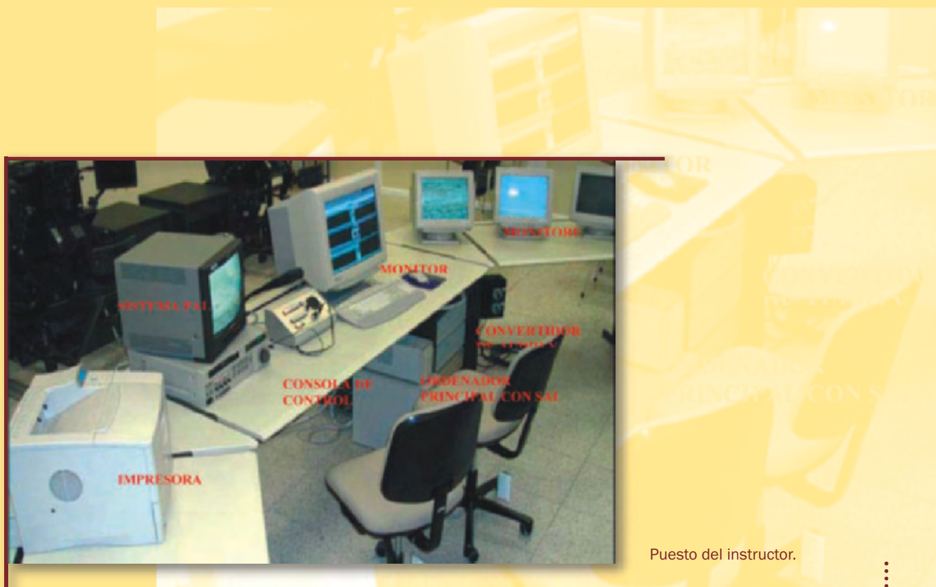
Puesto del instructor.

A esto hay que añadir otras limitaciones, como son: la mala calidad de imagen, superada actualmente con las nuevas tarjetas gráficas existentes en el mercado; imposibilidad de introducir nuevos escenarios y objetivos (aviones, helicópteros, vehículos terrestres, etc.), ni de modificar la posición del arma en el escenario seleccionado; tampoco se podían modificar las condiciones atmosféricas (iluminación, meteoros, etc.).